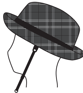
あごひもを付けた状態